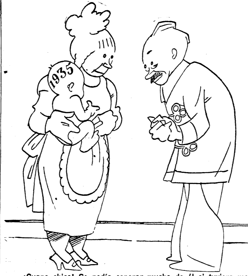
—Guapo chico! Se podía esperar mucho de él si tuviera mejor constitución.