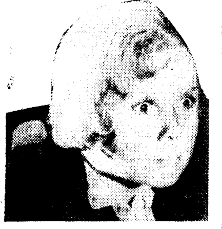
Jackie Cooper en "La isla del tesoro", extraordinario "film" que mañana se estrena en el Palacio de la Música.