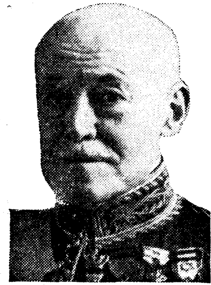
Don José Moreno Carbonero