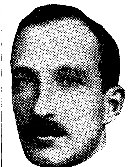
EL REY BORIS DE BULGARIA