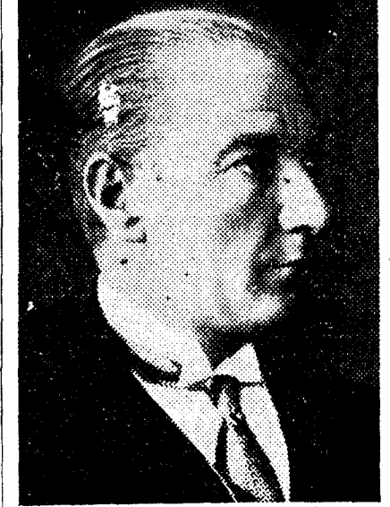
Kemal Ataturk (nombre recientemente tomado por Mustafa Kemal), Jefe de Estado de Turquía

De Macedonia no hay más noticias, pero del mar han llegado, y no buenas, la escuadra rebelde ha hecho acto de presencia ante Salónica por medio de un destructor, que surgió bruscamente de la niebla, disparó unos cañonazos y huyó. Los disparos no han producido ni víctimas ni daños, pero el Gobierno ha sembrado de minas los alrededores de Atenas para impedir un golpe parecido sobre la capital y ha reforzado las precauciones en Salónica. Por otra parte, el crucero "Averoff" y dos torpederos han llegado esta tarde a Mitilene, capital de la isla del mismo nombre. Un desembarco de marinos desembarcó y se hizo dueño sin resistencia del puerto. En sí la cosa no tiene valor militar ninguno, pues la isla no está defendida, pero se supone que allí podrá el crucero tomar carbón y viveres. También se anuncia sin detalles que los rebeldes han ocupado las islas de Chios y Samos. Se han interceptado "radios" del "Averoff", en el que se avisa a los rebeldes que va a Kavala con objeto de prestar auxilio a los rebeldes de Macedonia.