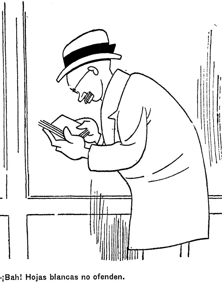
—¡Bah! Hojas blancas no ofenden.