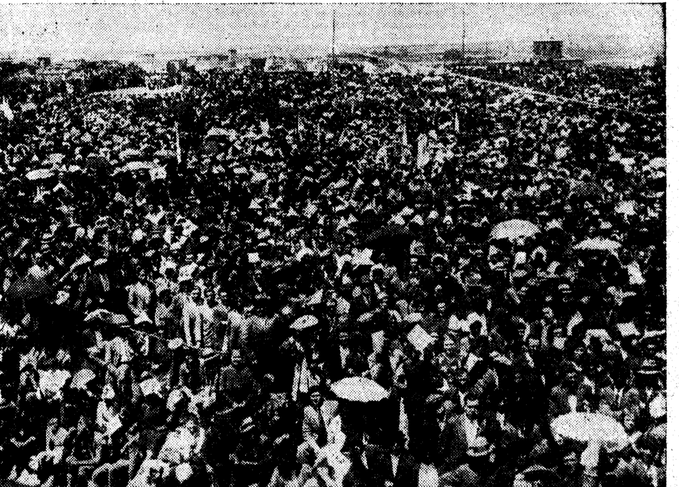
He aquí a la muchedumbre ante el castillo de La Mota. Desde las torres del puente levadizo se dominaba esta multitud entusiasmada, de pie sobre campos de sembradura, ante un fondo de iglesias y casonas castellanas. Un sol abrasador causó veinte insolaciones. Un entusiasmo aún más vivo llenó cincuenta mil pechos frente al castillo y el recuerdo de Isabel de Castilla