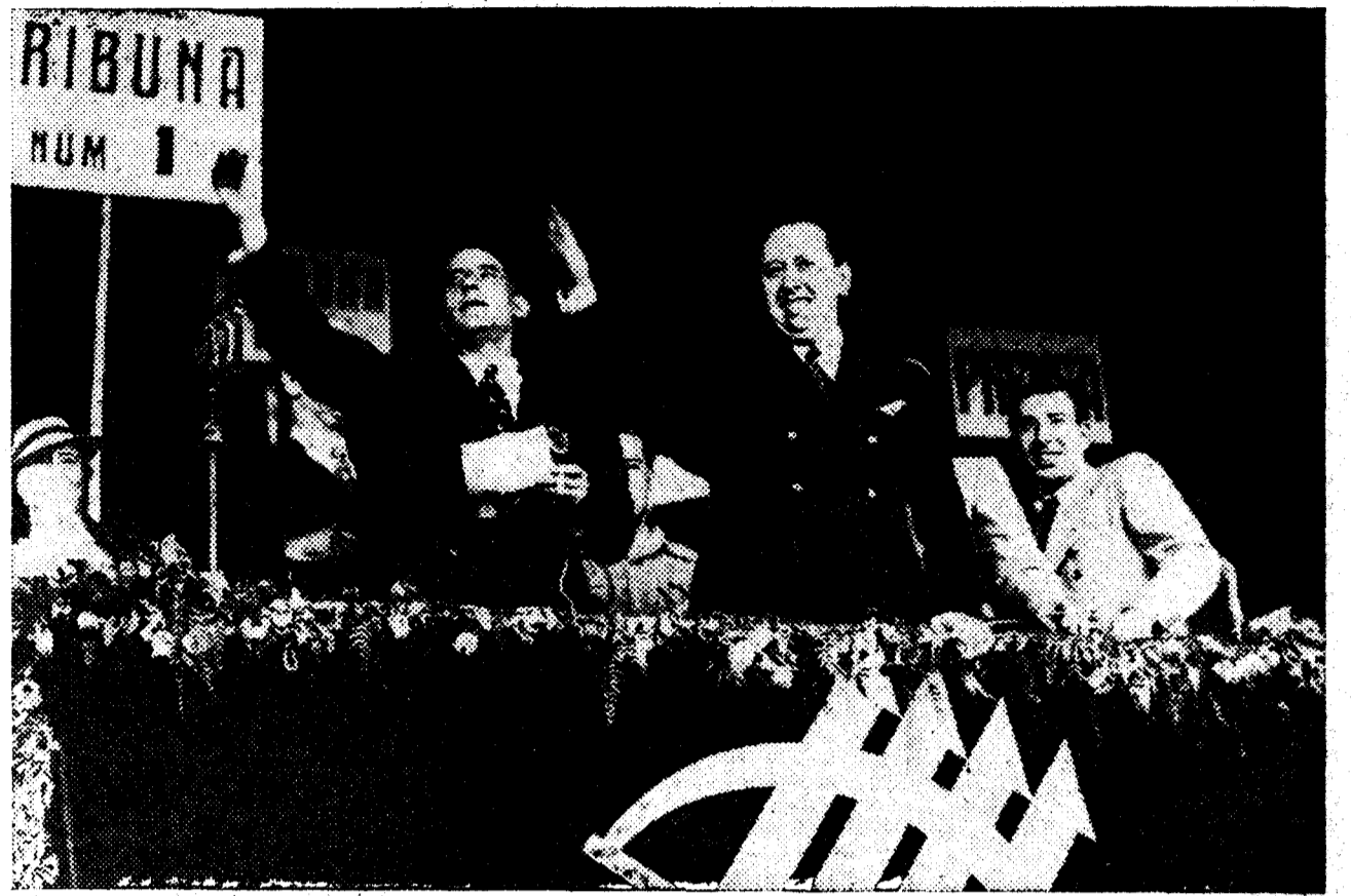
Los señores Gil Robles y Lucia saludan a la multitud al llegar al campo de Mestalla