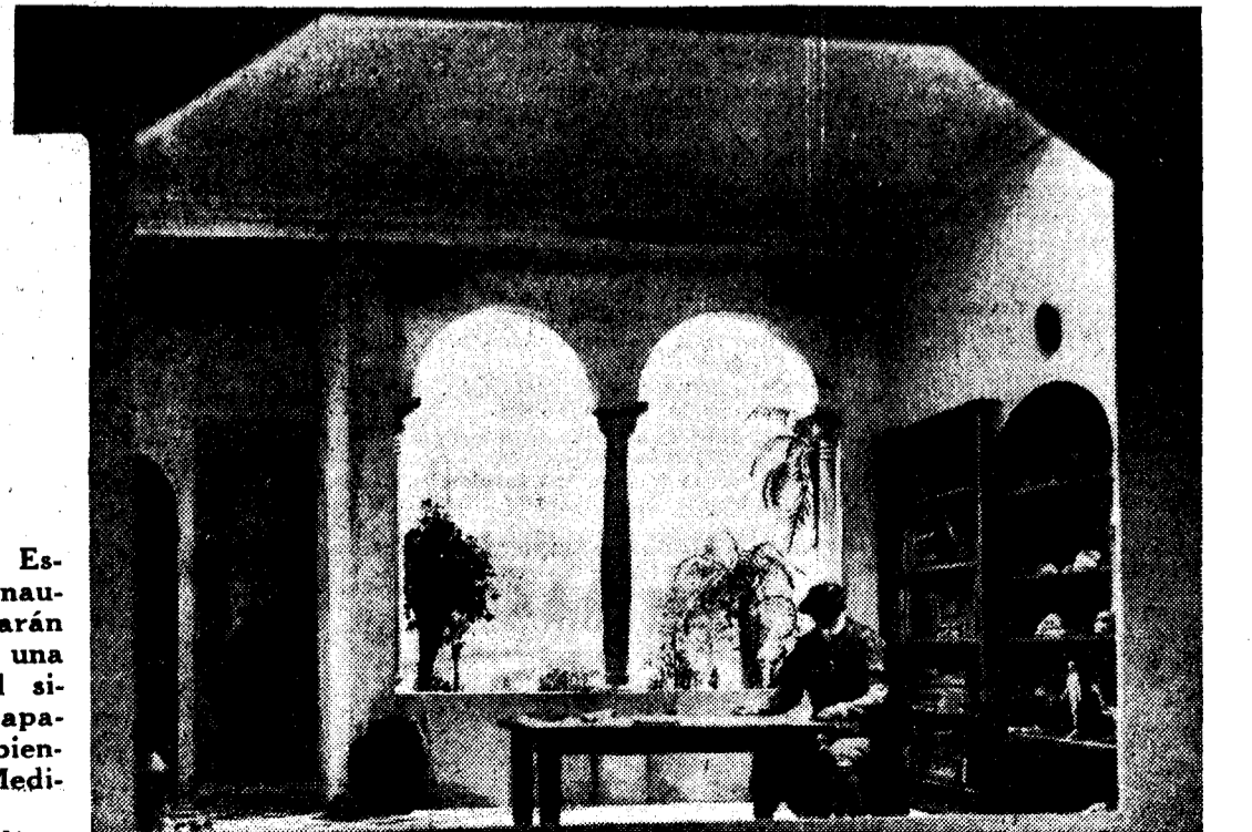
En la exposición del Libro Español de Medicina, que se inaugurará en el Senado, figurarán una maqueta que representa una botica hispanoárabe del siglo XIII, y otra en la que aparece Nicolás Monarde escribiendo su famosa "Historia Medicinal"