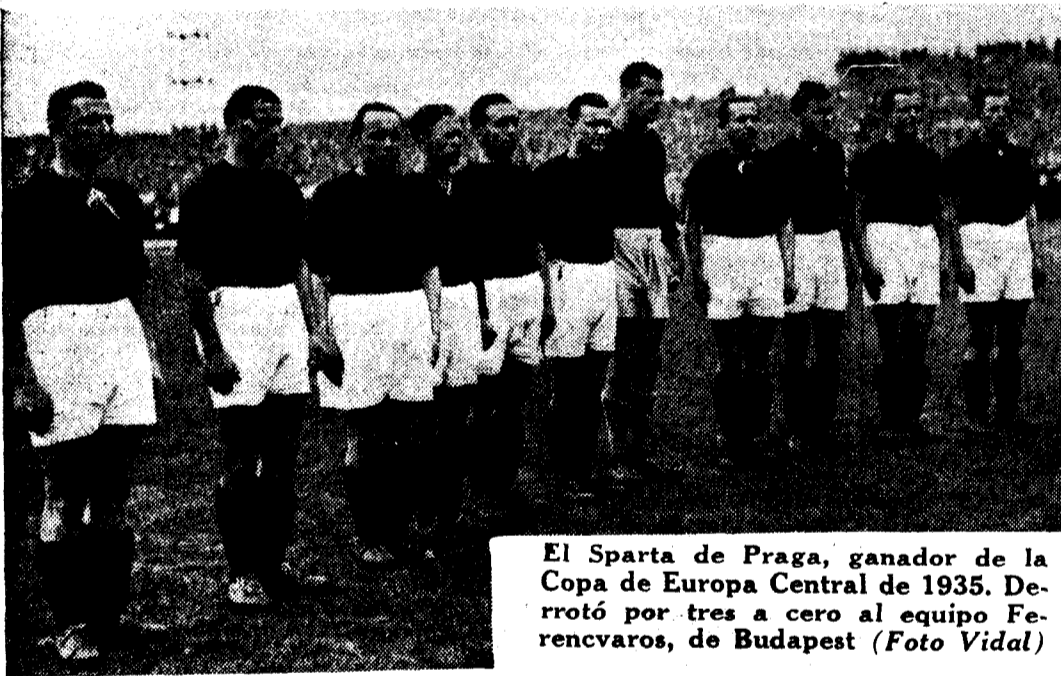
El Sparta de Praga, ganador de la Copa de Europa Central de 1935. Derrotó por tres a cero al equipo Ferencváros, de Budapest