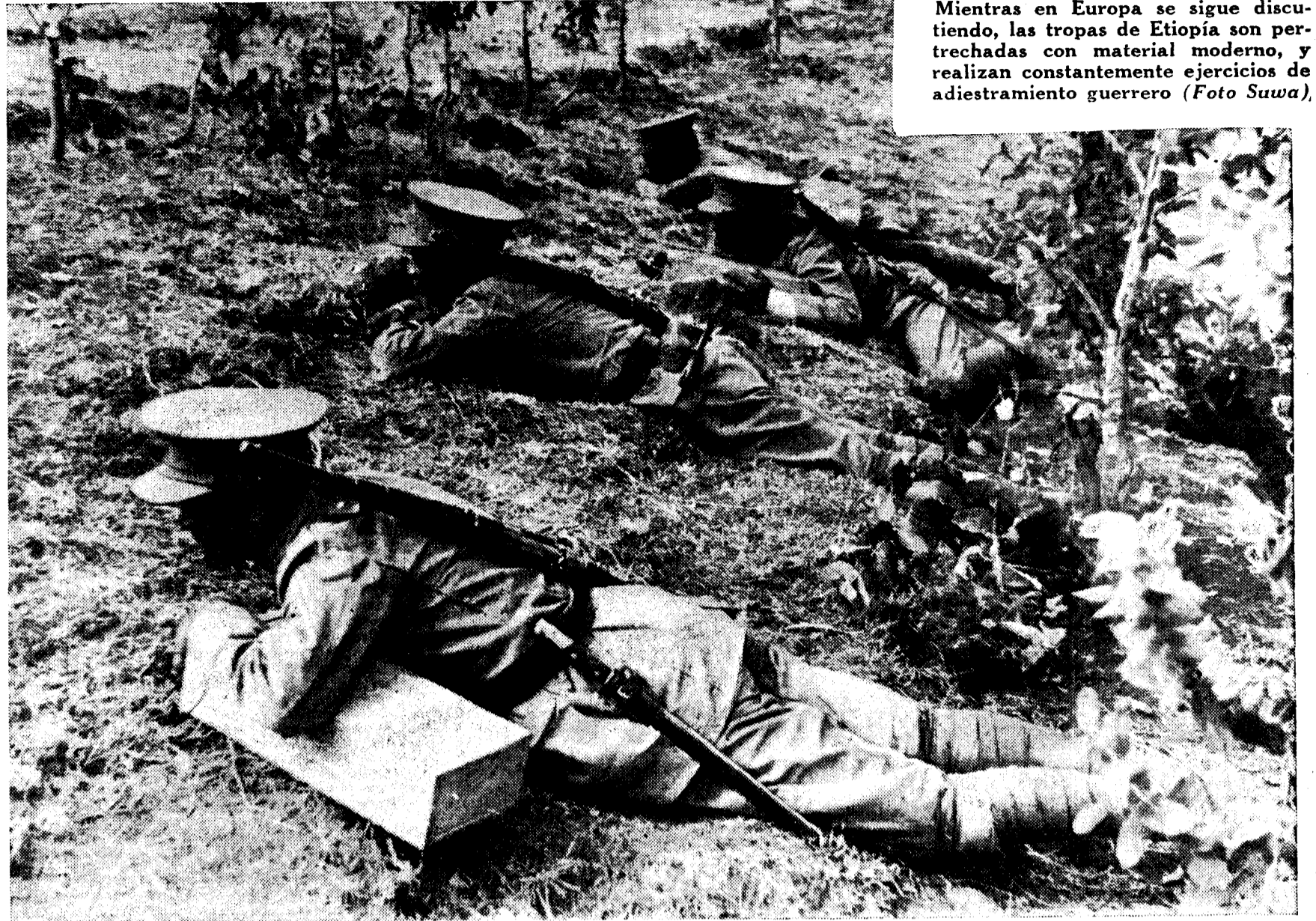
Mientras en Europa se sigue discutiendo, las tropas de Etiopía son pertrechadas con material moderno, y realizan constantemente ejercicios de adiestramiento guerrero.