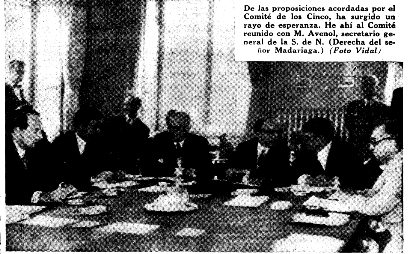
De las proposiciones acordadas por el Comité de los Cinco, ha surgido un rayo de esperanza. He ahí al Comité reunido con M. Avenol, secretario general de la S. de N. (Derecha del señor Madariaga.)