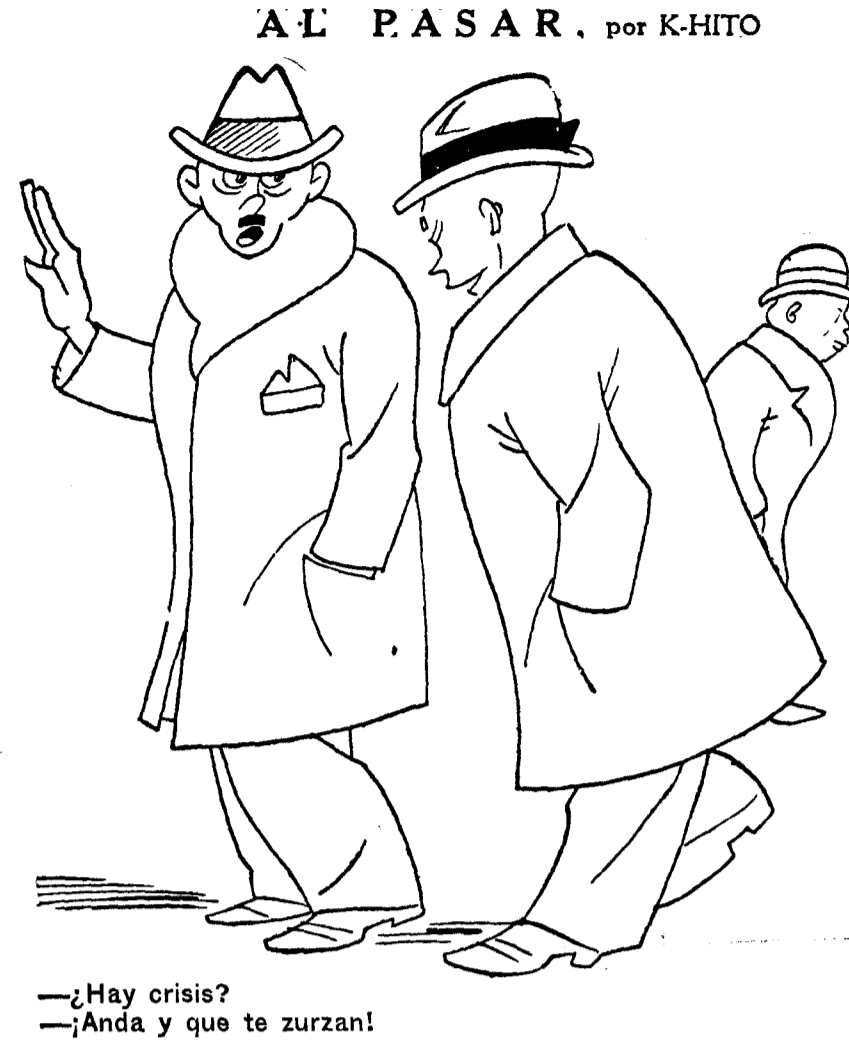
—¿Hay crisis? —¿Anda y que te zurzan!

Exige la A. S. S. U. el cumplimiento riguroso del Código de Honor en lo tocante a ejercicios y exámenes—de que ya he hablado anteriormente—y de las infamaciones que puedan ocurrir se ocupa el correspondiente Consejo de Inspección estudiantil, que propone los castigos oportunos. Fide también la Asociación a sus miembros absoluta integridad en el aspecto económico, o sea, cumplimiento de los compromisos, pago normal de cuentas, lo mismo entre individuos que entre clases o entre diferentes organizaciones: el abuso voluntario y continuado en asuntos de esta naturaleza podrá ser objeto de castigo en el dicho Consejo de Inspección.