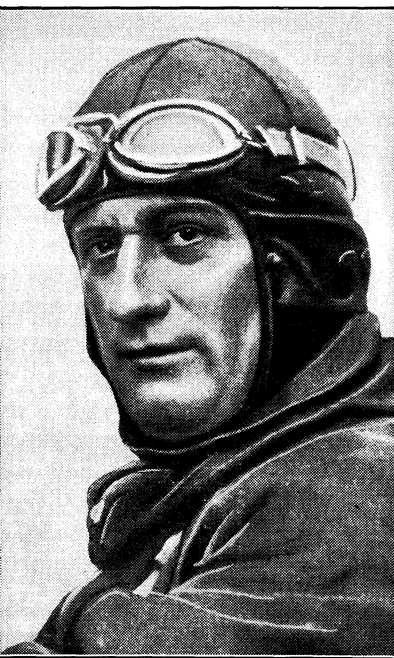
El aviador francés Raymond Delmotte, que ha batido el "record" mundial de velocidad en avión terrestre, consiguiendo 502 kilómetros hora