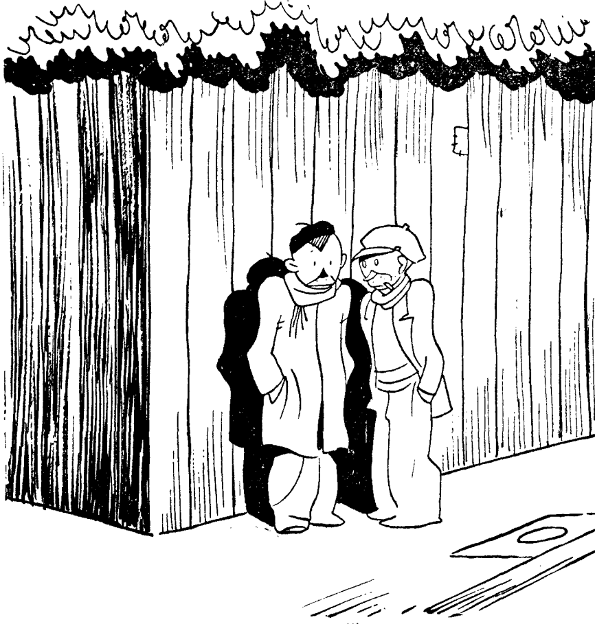
—Nosotros no somos más que unos pobrecitos "aficionados". "Pa" ladrones de "oficio" los que llevaban la orden de Denzás.