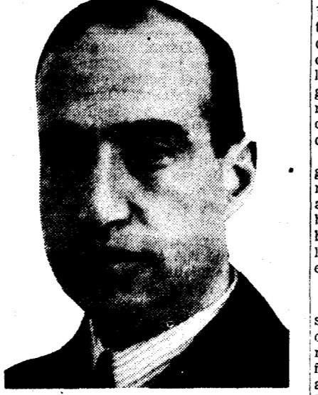
Don Ignacio Villalonga, nombrado gobernador general de Cataluña en el Consejo de ministros de ayer, ha hecho las siguientes declaraciones:

La designación para cargo de tanta importancia me ha cogido de sorpresa. La primera noticia que tuve me proporcionó un amigo en el momento mismo se me dijo que la prensa acogía dándolo como seguro. Esta mañana el ministro de Obras