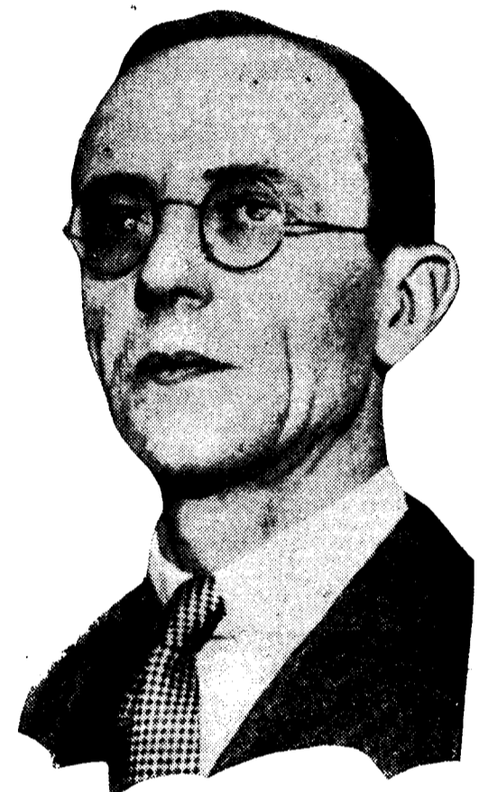
Mr. James Chadwick, profesor de la Universidad de Liverpool, a quien se ha concedido el Premio Nobel de Física de 1935