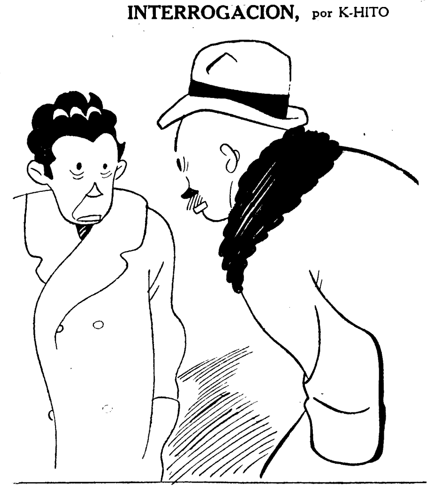
—¿Cree usted que habrá fórmula? —Por supuesto, digo por supuesto.