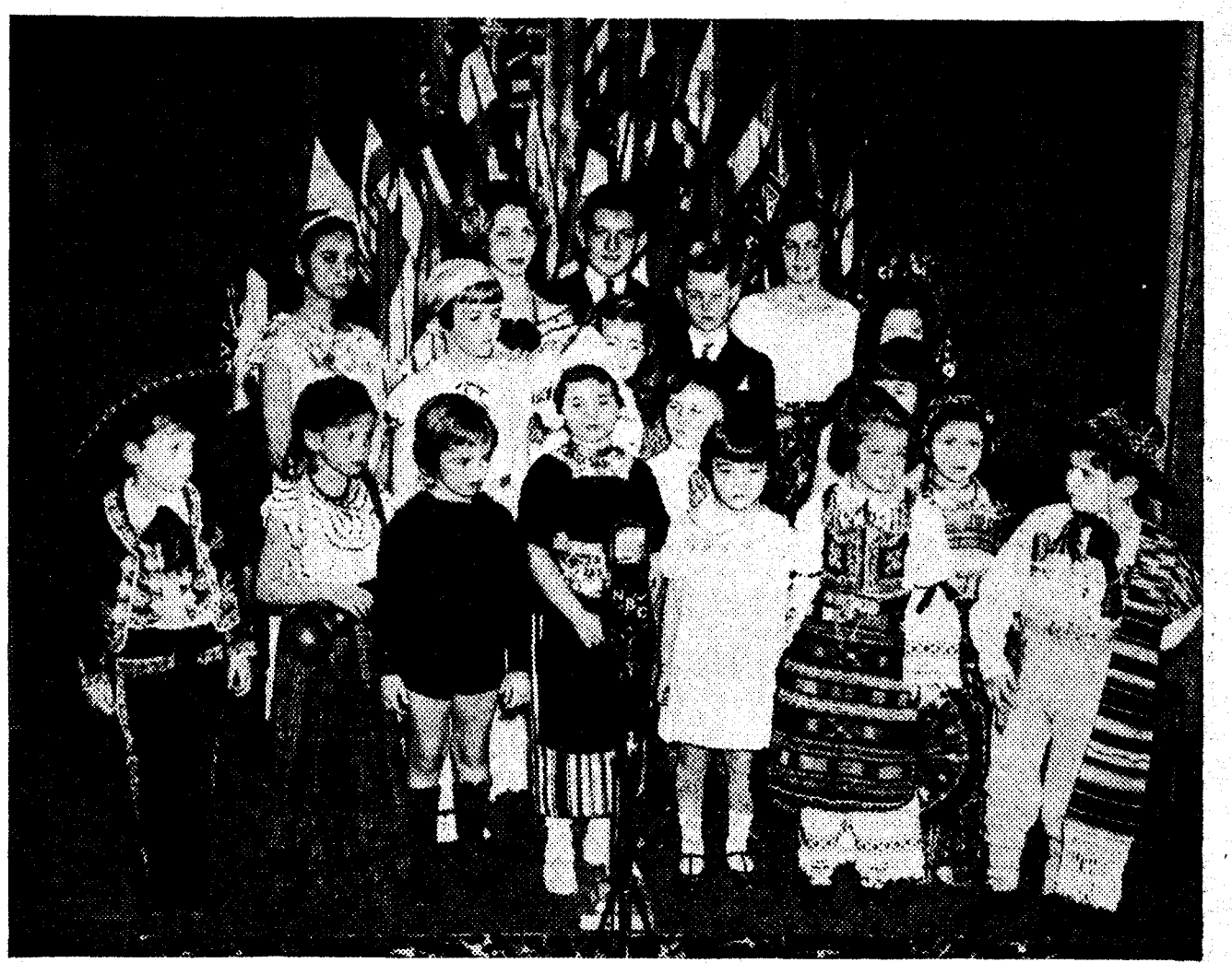
Los niños de los principales diplomáticos acreditados en Nueva York se han reunido en una fiesta para transmitir, en nombre de los niños de su respectivo país, su felicitación de Pascuas a los niños del mundo. Helos aquí ataviados algunos con los trajes nacionales, como ese mejicano pinturero y la graciosa nicaragiense que está junto a él. En cambio, la japonesa se viste con sencillas galas europeas

ROMA, 3.—El Pontífice ha nombrado al cardenal Mariani, jefe de la Comisión cardenalicia administradora de los bienes de la Santa Sede, dándole también el cargo de economo de todos los departamentos eclesiásticos. Como suplente suyo ha sido nombrado monseñor José Tondini.—Daffina.