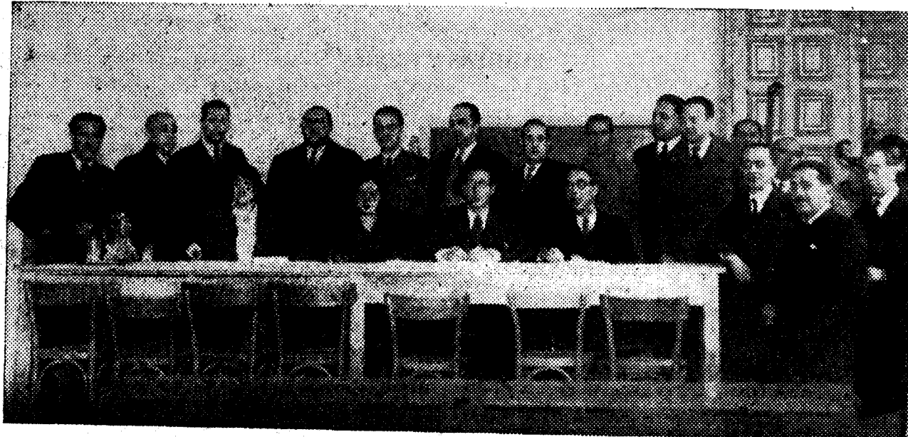
← Catedráticos de Instituto que asisten a la asamblea inaugurada ayer en el Instituto del Cardenal Cisneros