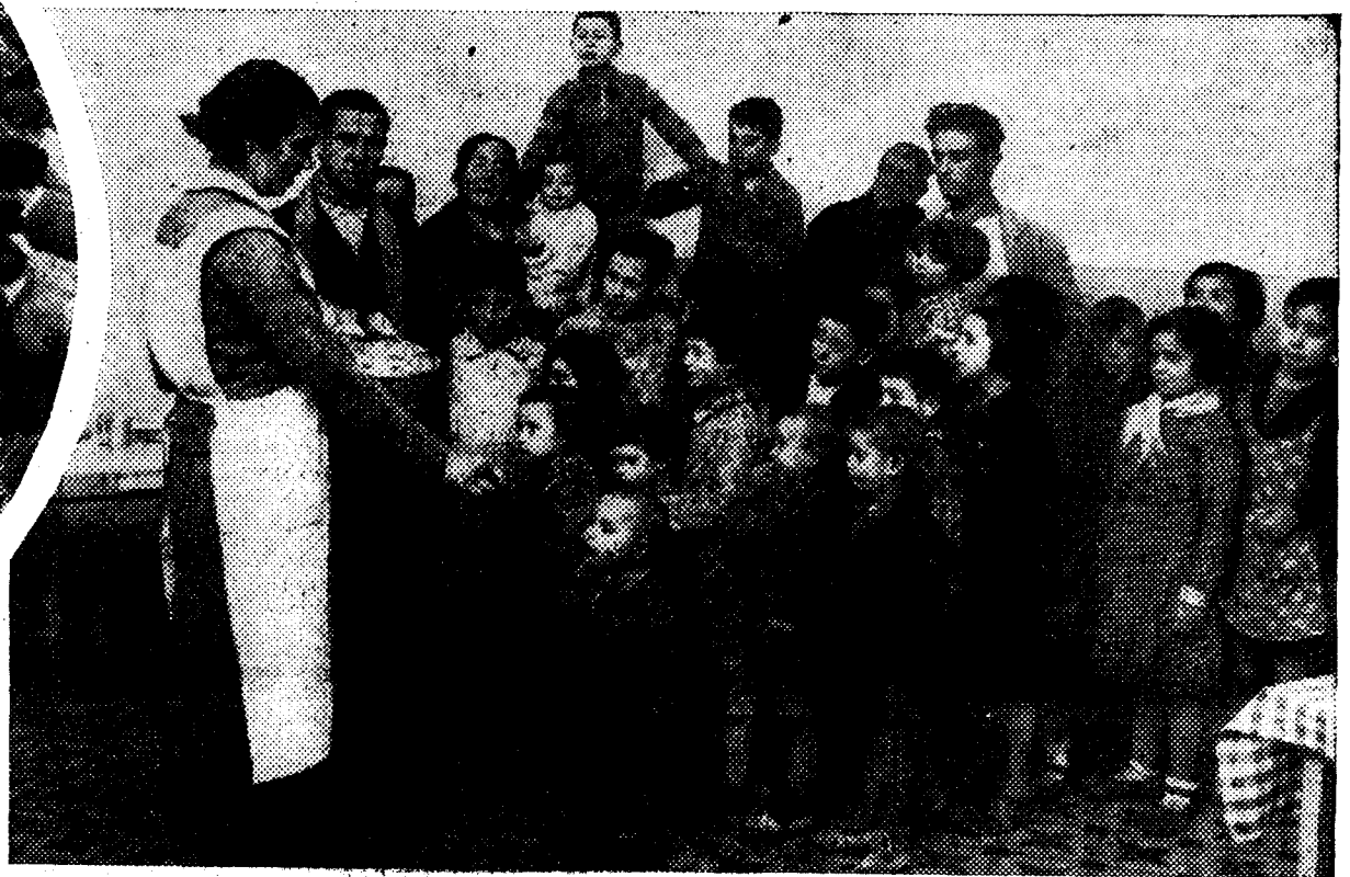
Reparto de pan en los comedores de las Damas Apostólicas de Valencia