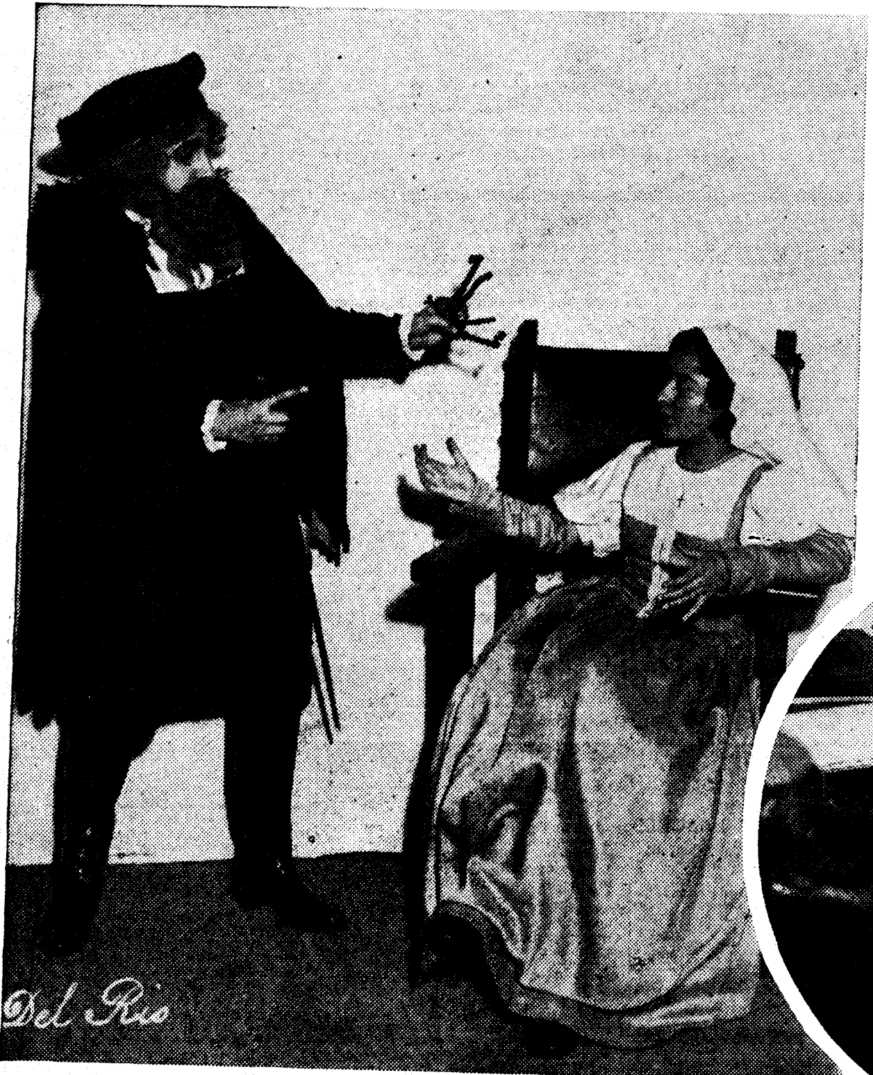
Los pequeños grandes artistas de la compañía infantil «B. A. T.», que en estos días realiza en el Calderón la «Semana de Jeromin»