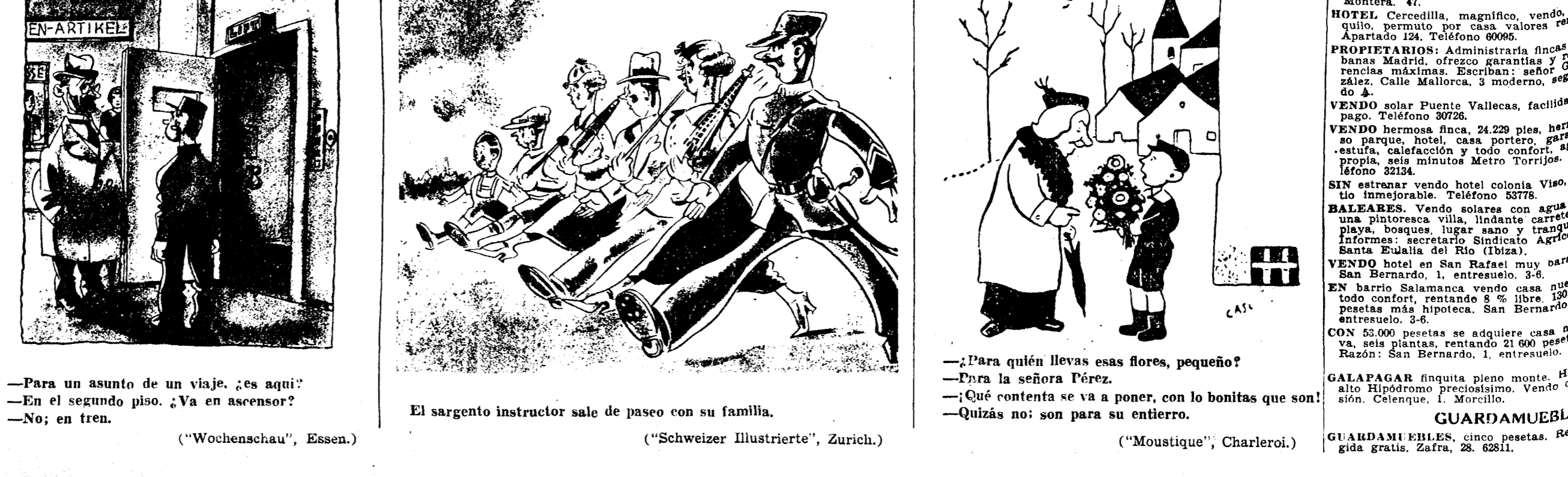
—Para un asunto de un viaje, ¿es aquí? —En el segundo piso, ¿Va en ascensor? —No, en tren. El sargento instructor sale de paseo con su familia. ("Wochenschau", Essen.) ("Schweizer Illustrierte", Zurich.) ("Moustique", Charleroi.)