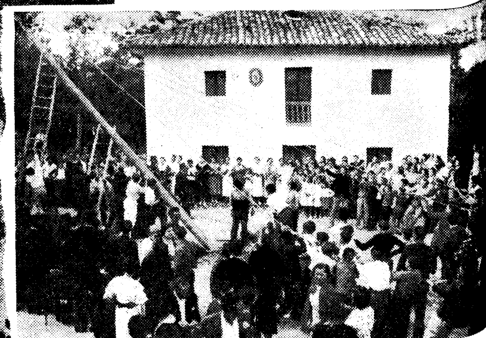
En el pueblo de Balmori, en la región de Llanes (Asturias), se han celebrado con el mismo entusiasmo de siempre, las fiestas de San Juan, Patrono de la localidad. Los fuertes mozos asturianos se afanan por elevar la hoguera que fué tributo al Santo en la noche que precedió a su fiesta