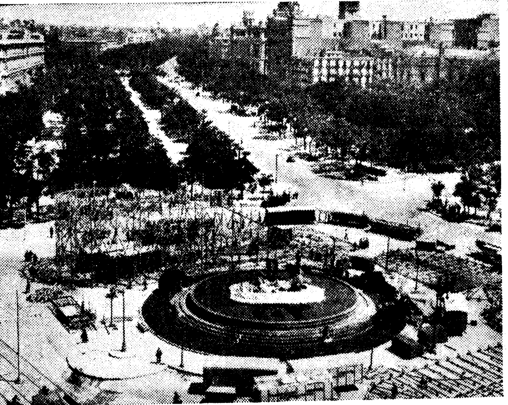
Tendremos, al fin, verbena de San Juan. Un poco tardía, pero ya segura. Alrededor de Neptuno los aparatos verbeneros en construcción, trenzan la complicación de sus esqueletos de madera y hierro