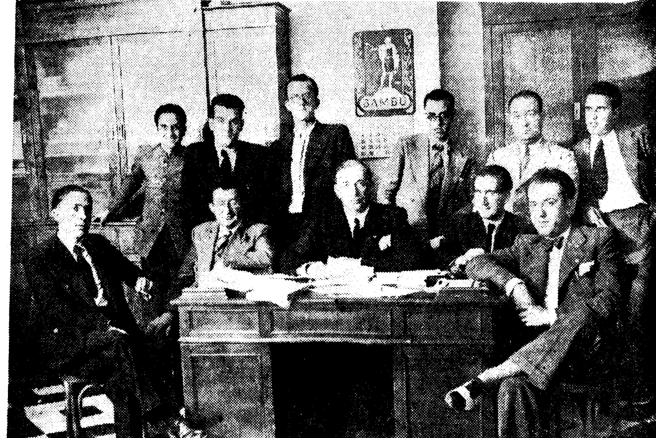
Presidencia de la Asamblea Provincial de Peritos Aparejadores, celebrada recientemente en el Círculo de Labradores de Córdoba, y en la que reinó un gran espíritu de confraternidad y entusiasmo profesional entre los numerosos asistentes

Entre las numerosas ceremonias celebradas en Londres con motivo del cumpleaños del rey de Inglaterra, Eduardo VIII, han revestido singular atractivo los desfiles militares. Las tropas de la guarnición londinense, vestidas con traje de gala, vistosas de colorido y espectaculares en su marcial formación, marchan a Palacio después de haberse concentrado para ser revistadas por el soberano. Y todo el recorrido a parece flanqueado por una doble multitud, que saluda con entusiasmo el paso de los soldados