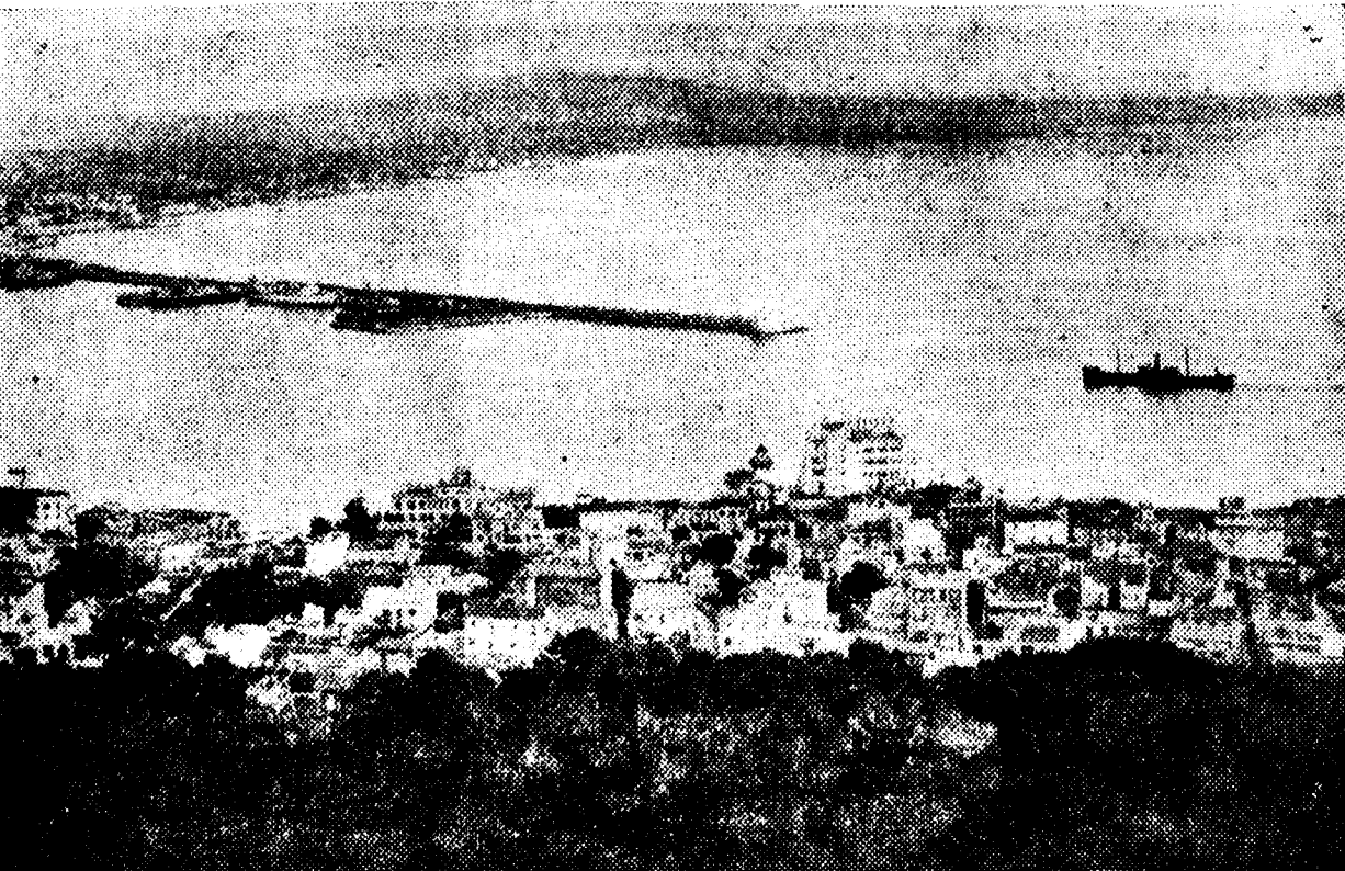
En Londres se asegura que Haile Selassie, a su regreso de Ginebra, residirá por algún tiempo en Mallorca. La belleza de la isla con sus bahías de amplio panorama, el atractivo de su clima y el prestigio de sus incomparables grutas, justifica, en verdad, la supuesta decisión del Negus

Entre las numerosas ceremonias celebradas en Londres con motivo del cumpleaños del rey de Inglaterra, Eduardo VIII, han revestido singular atractivo los desfiles militares. Las tropas de la guarnición londinense, vestidas con traje de gala, vistosas de colorido y espectaculares en su marcial formación, marchan a Palacio después de haberse concentrado para ser revistadas por el soberano. Y todo el recorrido a parece flanqueado por una doble multitud, que saluda con entusiasmo el paso de los soldados