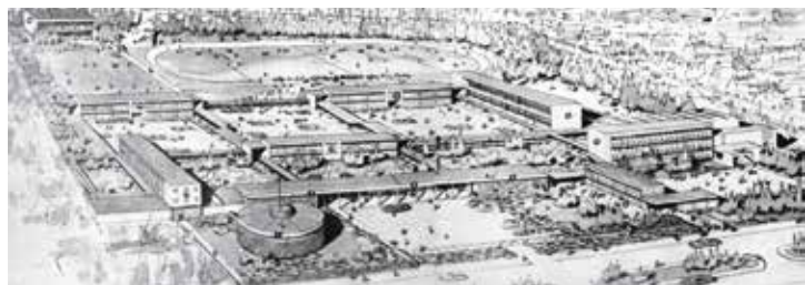
Fig. 15. Perspectiva aérea del anteproyecto del Colegio San Ignacio El Bosque. Anuario Colegio San Ignacio 1959

que entregan una expresión abstracta a sus fachadas, a través de la composición de vanos, celosías, carpinterías de acero y superficies acristaladas. Esta aproximación debe ser entendida como una innovación constructiva en Chile, que mantenía el control medioambiental en los criterios de definición de la forma arquitectónica y en la calidad plástica y espacial que presentan las soluciones constructivas, en coherencia con el espíritu tecnológico de la institución.