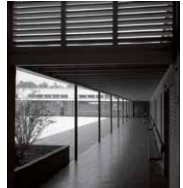
Fig. 6. Kindergarten del Colegio del Verbo Divino hacia 1962.

on-site building placement and the abstract expression of its architecture that can be seen in aspects like the organization of their overall disposition of the pavilions, the scale of the buildings and the concern for environmental control components for the similar climate and geography shared by the state of California and central Chile.