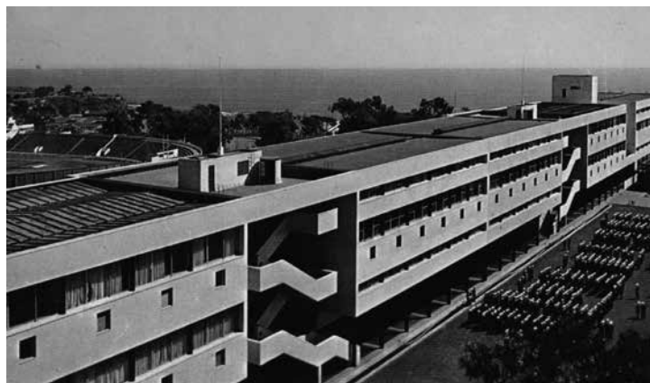
Fig. 13. Escuela Naval de Valparaíso.

en un esquema rectangular, que liberaba en su interior una sucesión de patios interconectados. Ese cuerpo aparece parcialmente levantado gracias a una estructura de marcos rígidos de hormigón armado que conecta los espacios comunes, liberando superficies bajo el pabellón de aulas, que entregaban espacios de sombra y que sirve como patio cubierto en los días de lluvia. Sobre él, la estructura presenta parasoles de hormigón armado, carpinterías metálicas y superficies acristaladas, cuidando el asoleamiento en el interior de las aulas. Al centro del conjunto se planteó una iglesia, que era el volumen de mayor jerarquía y articulador del conjunto, la cual no fue construida, al igual que el resto del perímetro del partido general original. Un cuerpo aislado, de un solo nivel y más transparente, estaba destinando al jardín infantil y se conectaba al resto del conjunto por una circulación cubierta.