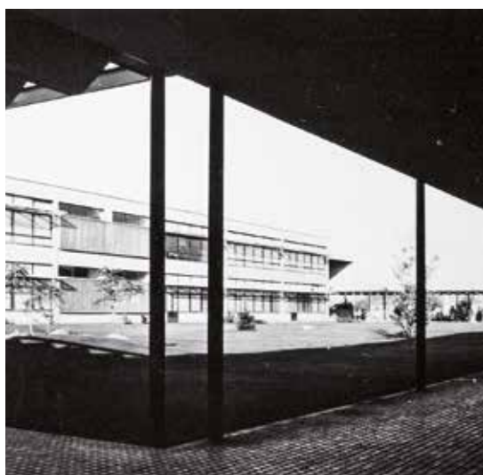
Fig. 18. Jardín central, pabellón de humanidades y corredores cubiertos del Colegio San Ignacio El Bosque hacia 1962. Fig. 19. Corredores cubiertos, prefectura y pabellón de humanidades del Colegio San Ignacio El Bosque hacia 1964.

En ellas es posible encontrar constantes y pertinencias y una evidente re-orientación, compartiendo aproximaciones similares, como la cuidada situación de los edificios en el lugar, la relación con el paisaje y el entorno, las consideraciones medioambientales o el entendimiento del tecnicismo necesario para el espacio educativo. En ellas es posible establecer además, lecturas en torno a temáticas más generales, como la técnica constructiva en un país sísmico y su expresión plástica y en algunos casos, en la integración de las artes o el paisajismo al proyecto arquitectónico para dar respuesta desde la arquitectura a las necesidades pedagógicas de la enseñanza. (8)