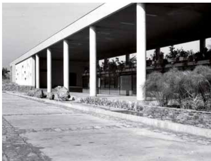
Fig. 16. Pabellón de acceso del Colegio San Ignacio El Bosque hacia 1962. Fotografía de Alberto Piwonka. Archivo familia Alberto Piwonka Fig. 17. Pabellón de acceso Colegio del San Ignacio El Bosque hacia 1962. Fotografía de Alberto Piwonka. Archivo familia Alberto Piwonka.

Como un corolario de esa tradición y posiblemente como uno de los casos más destacados, se encuentra el Colegio San Ignacio El Bosque, (Fig. 15) levantado en Santiago a finales de la década de los cincuenta, que es obra de Piwonka asociado en una primera etapa con Schmidt. El proyecto presenta una radicalidad en sus planteamientos en torno al espacio pedagógico, profundizando las ideas que había materializado el propio Piwonka en el Colegio del Verbo Divino, pero dando a la obra un vuelo moderno excepcional. El conjunto, que disponía cuidadosamente los volúmenes en el solar, planteaba con mayor fuerza que en los casos anteriores una monumentalidad y abstracción, a través de la articulación de volúmenes lineales cohesionados y compactos de gran prestancia y expresión plástica, que resulta de las consideraciones constructivas y materiales, la presencia de los elementos estructurales, revestimientos, acabados, el uso color y la integración del arte abstracto a su arquitectura. (Figs. 16 y 17)