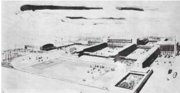
Fig. 5. Perspectiva Colegio del Verbo Divino hacia 1950. Anuario Colegio del Verbo Divino, año 1975

Algunas obras de esa tradición. El Colegio del Verbo Divino (Figs. 5 y 6) representa el inicio de esa nueva tradición educacional y una ruptura con los cánones anteriores de este tipo de edificaciones en Chile. El proyecto buscaba instaurar un modelo de enseñanza centrado en el ciclo de vida del estudiante y en estrecha relación de los recintos con los espacios exteriores, la naturaleza y las vistas al paisaje de la cordillera de los Andes. Las circulaciones fueron entendidas como espacios intermedios y los edificios potencian el contacto con el exterior, a través de su relación con patios, jardines y zonas deportivas. Para