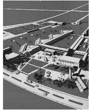
Fig. 1. Escuela Hermanos Matte (1935) Gustavo Mönckeberg y José Aracena. Hevia, P., Fernández, J. y Home, D. Una experiencia educativa: Sociedad de Instrucción Primaria . 150 años. Santiago: Origo, 2010