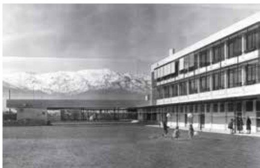
Fig. 12. Colegio Compañía de María hacia 1960.