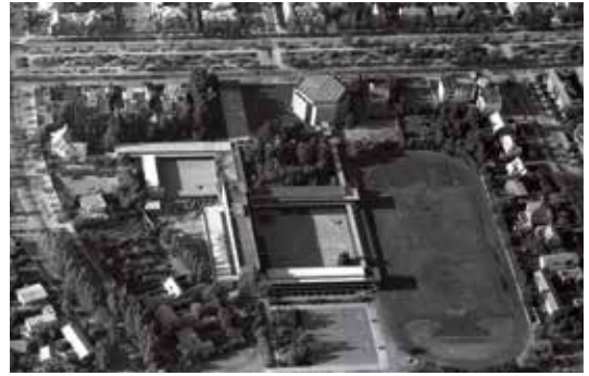
Fig. 7. Colegio del Verbo Divino hacia 1962.