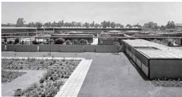
Fig. 14. Universidad Técnica del Estado hacia 1964.

En esos años se levantó en Chile además otra edificación notable que enriqueció el cuerpo de esa tradición educacional: la Universidad Técnica del Estado, (Fig. 14) proyecto liderado por la oficina Bresciani, Valdés, Castillo y Huidobro. A la manera de un campus, el conjunto se configura a través de la cuidada disposición de los edificios en el solar, con pabellones de distintos tamaños para aulas, laboratorios y talleres, que se articulan entre ellos a través de patios y corredores cubiertos. Posiblemente, por el carácter tecnológico y científico de su enseñanza, este conjunto educacional fue levantado con un sistema estructural mixto, donde predominan las estructuras metálicas reforzadas con elementos de hormigón armado,