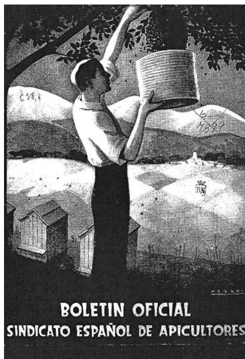
Portada del Boletín del Sindicato Nacional de Apicultores , bello diseño de los años 30.

(Madrid, 1835), que consta de 112 págs. en 8°. Se trata en el mismo de las costumbres de las abejas, todo un ejemplo para el hombre de prudencia, templanza, economía, industria, aplicación, ocupación continua y moderada, aseo, amor a nuestros semejantes, deseos de prosperidad pública sin envidia ni ambición, buen espíritu de sociedad y aborrecimiento a la holganza. Después de tratar de todo lo concerniente a la explotación del colmenar, presenta una interesante contabilidad del coste y producción de cien colmenas con los útiles correspondientes, según la cual se necesita una inversión inicial de 4.992 reales, el primer año se precisan también otros 516 de mantenimiento, sin embargo ya en el segundo año se consigue amortizar toda la inversión con un superávit de 2.356 reales. Al final concluye con las siguientes reflexiones sobre las posibilidades apícolas de la zona en la que seguramente se movía el autor, que buscaban fomentar la colmenería: